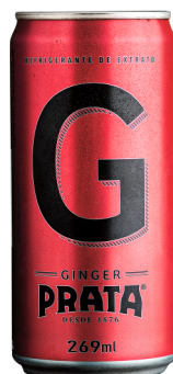
Ginger lata 269mL Cód. 3863