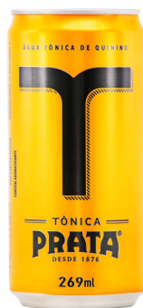
Tônica lata 269mL Cód. 2916