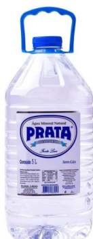
Água Natural Galão Pet 5 L Cód. 3207