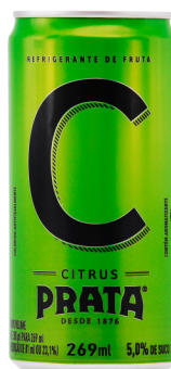
Refrigerante Citrus Lata 269ml Cód. 2932